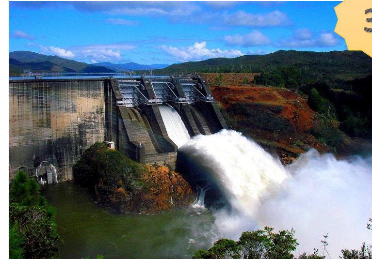
Barrage de Yaté