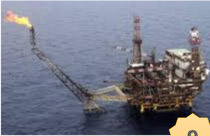
Gisement pétrolier offshore