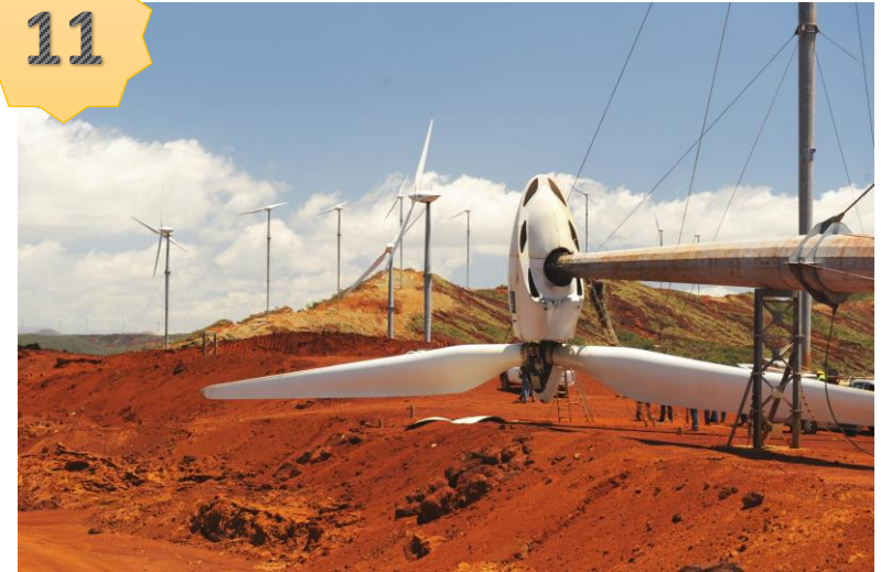
Éolienne de Prony appartenant à la commune de Mont-Dore