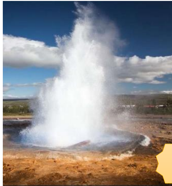
Energie géothermique en Islande